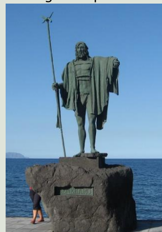
Statue en bronze du roi Beneharo à Candelaria, Tenerife.